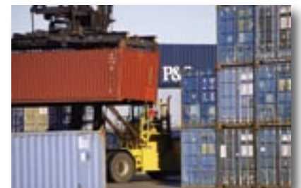
Industrie des transports