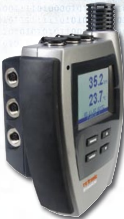
NT3 avec station d'accueil

Que ce soit pour les technologies climatiques, le travail du papier, l'industrie alimentaire ou le secteur météorologique, il n'est pas de secteur où l'HygroLog NT ne puisse enregistrer des données de manière économique, précise et reproductible.