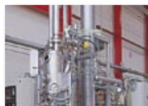
Processus de séchage