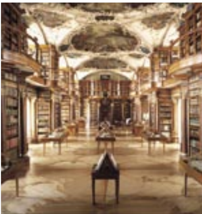
Musées, bibliothèques, galeries