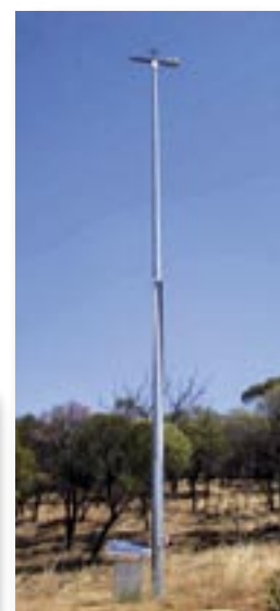
Recherche et météorologie